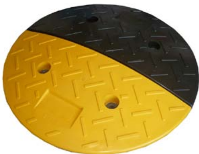
Tempoteller Art.-Nr. 159 136 AG Euro -