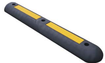
Fahrbahnschwelle Art.-Nr. 159 138 AG Euro -