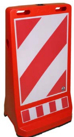
Parkplatz-Warnaufsteller Art.-Nr. 159 131 AG Euro -