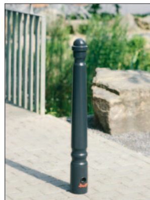
Typ „Konisch“, mit Ringtaillen