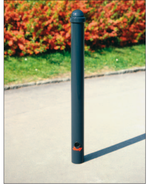
Stilsperpfosten Typ „Rund“ mit Helmkopf „HLK“