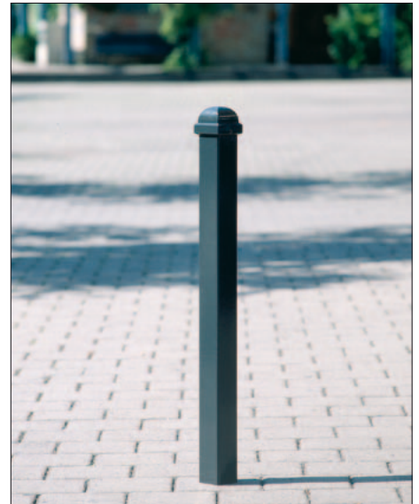
Stilsperpfosten Typ „Quadratisch“, zum Einbetonieren