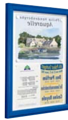
Schaukasten „BASIC“ in RAL 5010 und Alu eloxiert mit Ständerpaar