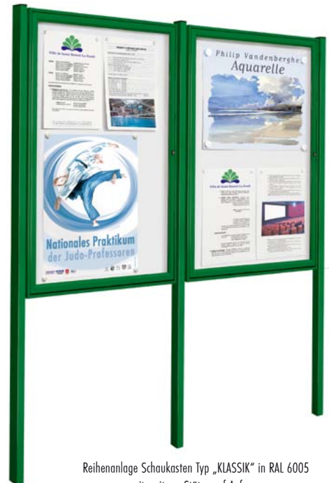
Reihenanlage Schaukasten Typ „KLASSIK“ in RAL 6005 mit weiterer Stütze auf Anfrage