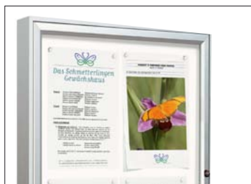
„KLASSIK“ Alu eloxiert