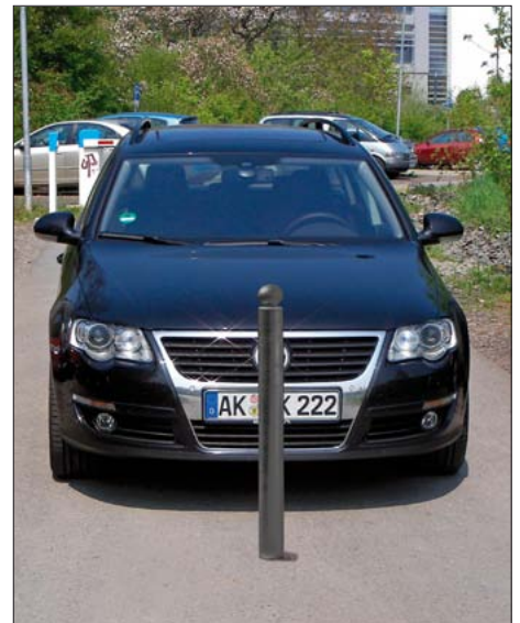
Poller mit Kugelkopf, verzinkt und pulverbeschichtet in RAL 7021