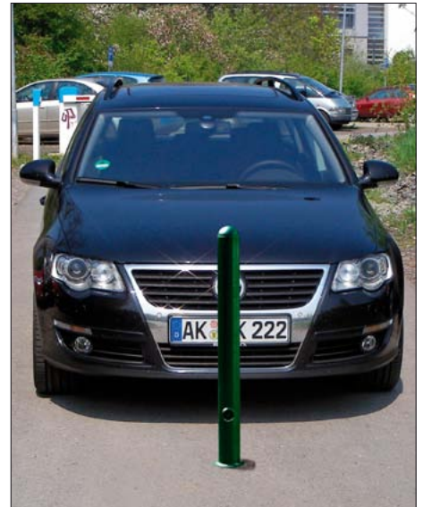
Poller mit Halbkugelkappe, verzinkt und pulverbeschichtet in RAL 6005