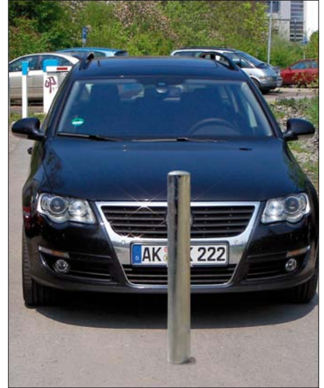
Poller mit gewölbter Abdeckung zum Einbetonieren, verzinkt