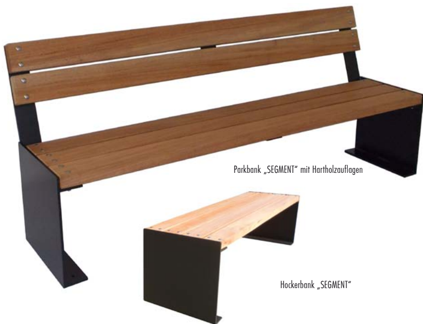
Parkbank „SEGMENT“ mit Hartholzauflagen