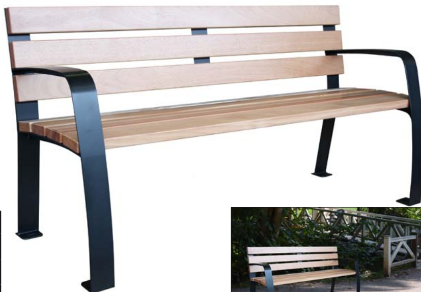
Parkbank „URBAN“ mit Hartholzauflagen