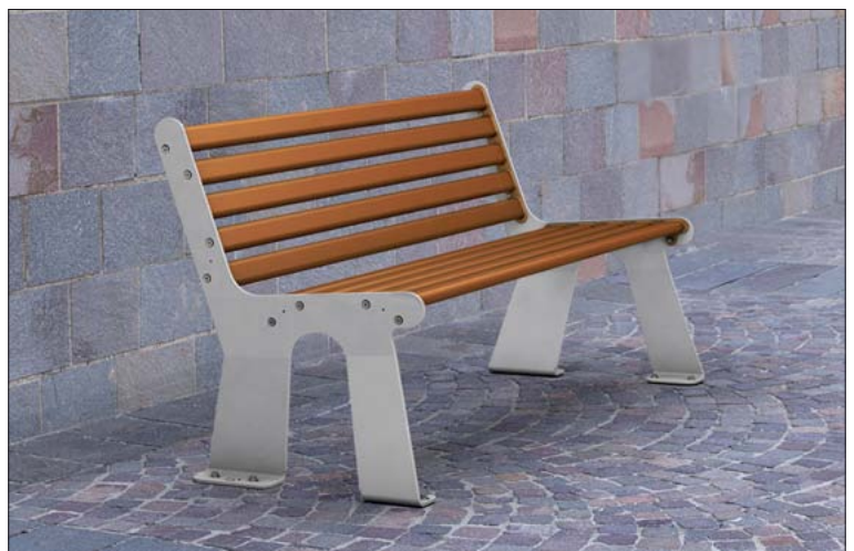
Parkbank „METAL“ Ausführung Seitenwangen RAL 9006 weißaluminium Sitzfläche RAL 8023 orangenbraun