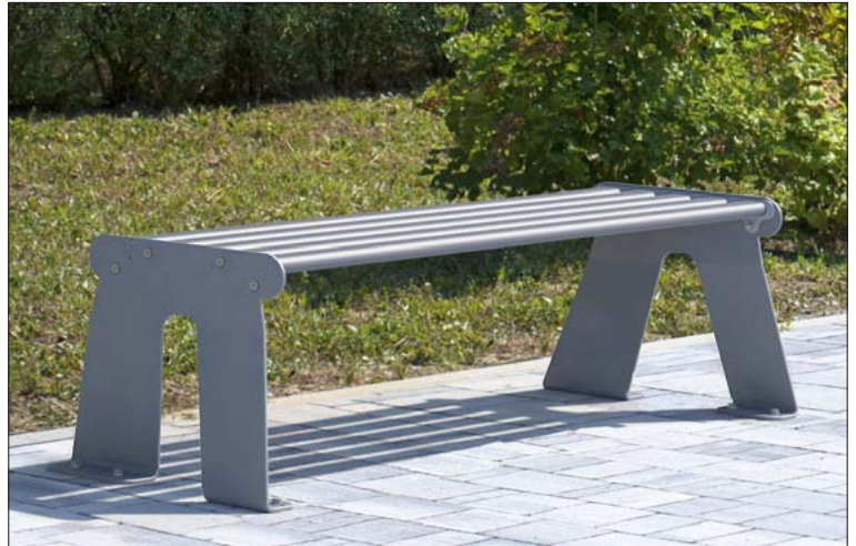
Hockerbank „METAL“ Ausführung Unifarben RAL 9006 weißaluminium