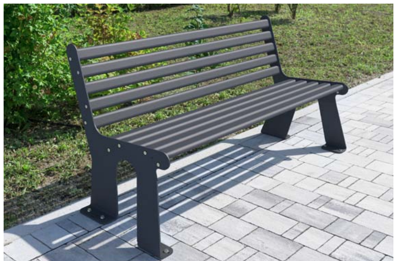
Parkbank „METAL“ Ausführung in RAL 7016 anthrazitgrau