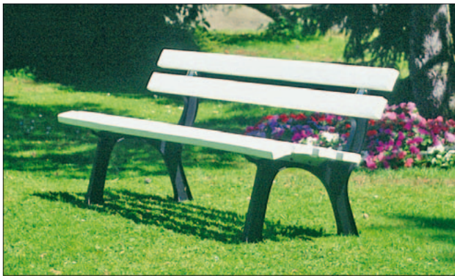
Sitzbank mit Gussuntergestell und Recycling-Bohlen in weiß

Kunststoff gewinnt immer mehr an Bedeutung, denn sie sind sozusagen „wartungsfrei“. Durch eine umfangreiche Farbauswahl passen sich die Bänke hervorragend ihrer Umgebung an. Für den ländlichen Bereich wählen Sie zwischen der Holzart Nordische Fichte (kesseldruckimprägniert) und Kambala. Alle Auflagenvarianten lassen sich auch mit einem massiven, gusseisernen Untergestell in schwarz beschichtet kombinieren. Die Rückenlehne wird mit 3 Bohlen (außer bei Kunststoff-Recycling mit 2 Bohlen) und die Sitzfläche mit 4 Bohlen ausgestattet. Bei Bestellung bitte Farbe für Kunststoff-Bohlen mit angeben! Für PVC-Bohlen: hell-elfenbein, rot, braun und grün. Für Kunststoff-Recycling-Bohlen: braun, grün und weiß.