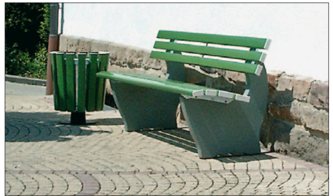
Sitzbank mit Untergestell Modell 2 (M2) zum freien Aufstellen