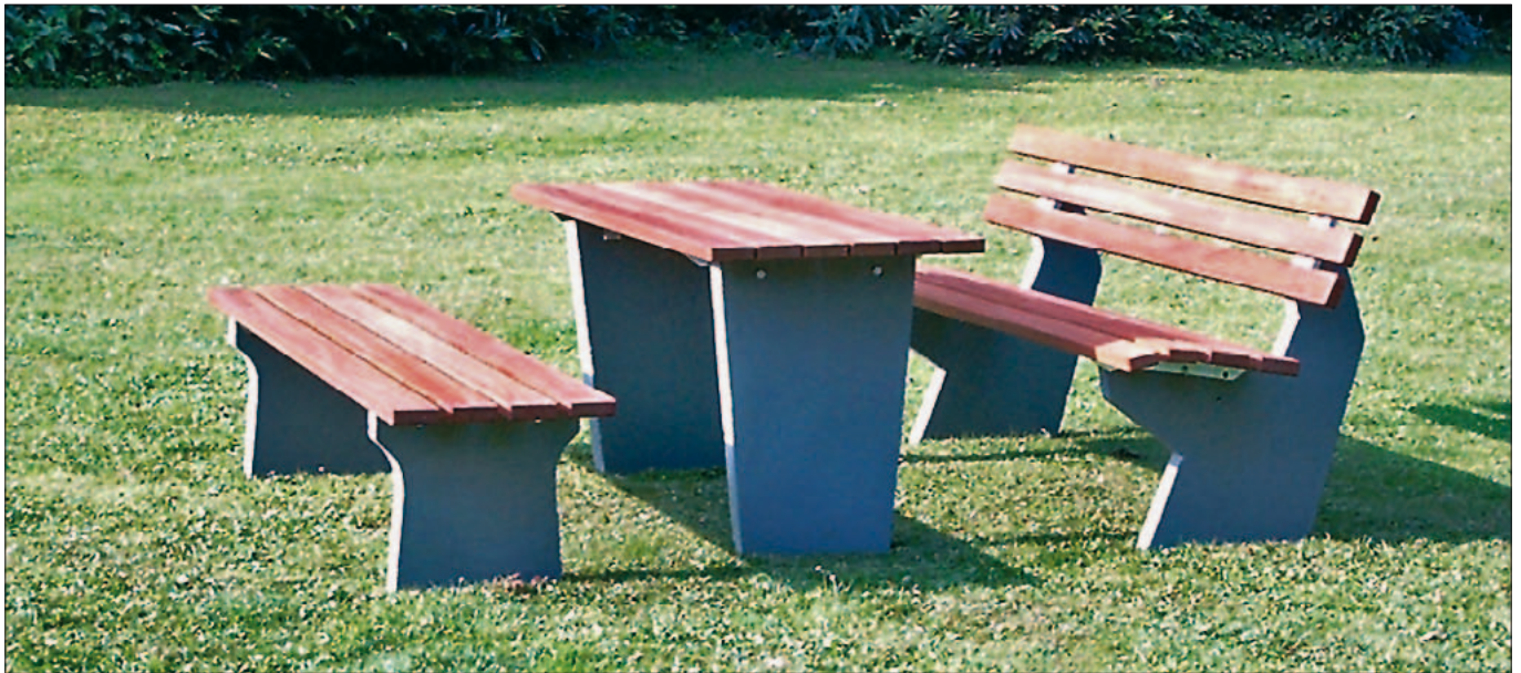
Kombination: Tisch mit Hocker- und Parkbank, Ausführung Betonsockel M1 zum Eingraben, Auflagen in der Holzart Kambala, Oberfläche lasiert

Parkbänke für den robusten Einsatzzweck. Die Betonfüße zum Eingraben oder zum freien Aufstellen (M2) sorgen auch bei schwierigem Gelände für einen sicheren Stand. Für die Sitzbänke stehen zwei Modellformen (M1 und M2) zur Auswahl, welche mit verschiedenen Kunststoff- und Holzbohlen variiert werden können.