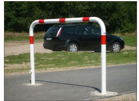
Absperrbügel rot/weiß ohne Mittelstrebe

*Sperrkeitszuschlag - Frachtkostenpauschale für 1-4 Stück Euro 36,00 - ab 5 Stück „frei Haus“.