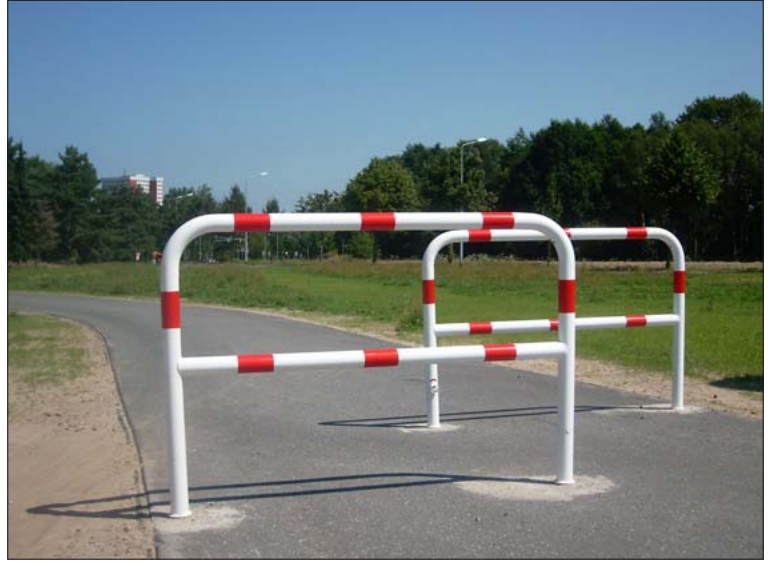
Absperrbügel rot/weiß mit Mittelstrebe