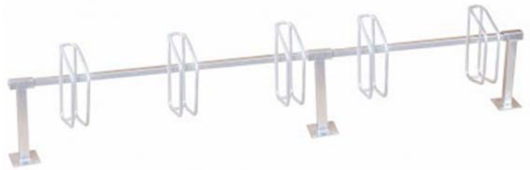
Reihenparker „STRING“ mit 5 Stellplätze zum Aufdübeln