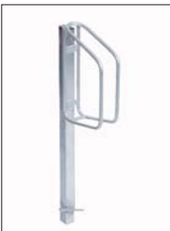
„STRING“ zum Einbetonieren