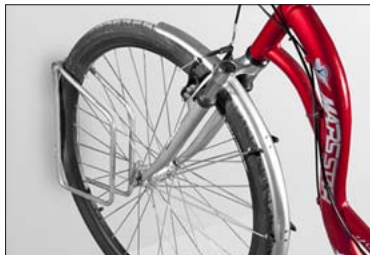
Einzelparker „STRING“ zur Wandmontage 90°