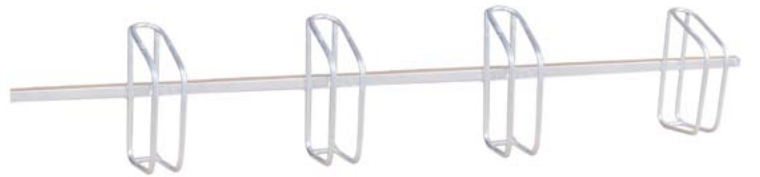
Reihenparker „STRING“ mit 4 Stellplätze zur Wandmontage