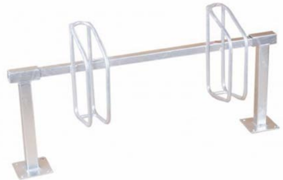
Reihenparker „STRING“ mit 2 Stellplätze zum Aufdübeln