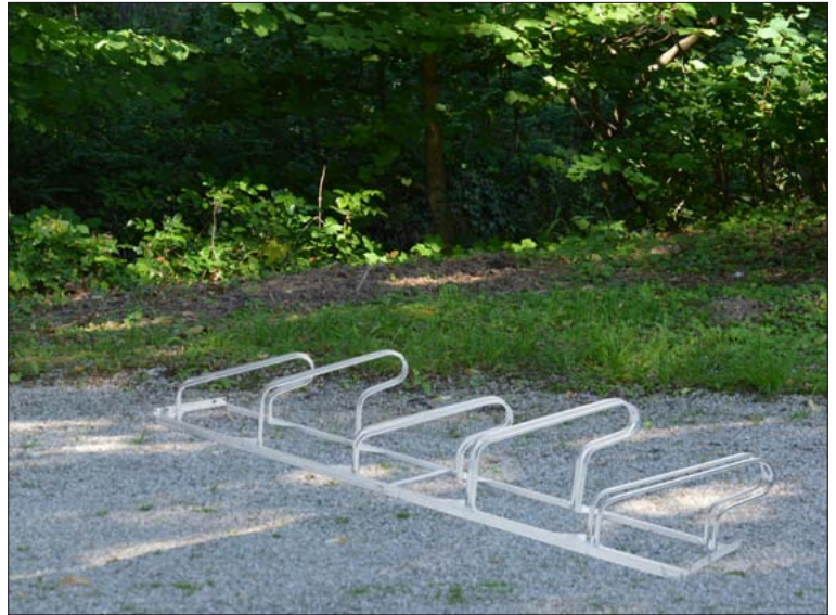
„Der Klassiker“ 45° Schrägstellung nach links