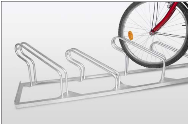
Einstellwinkel 45° nach rechts