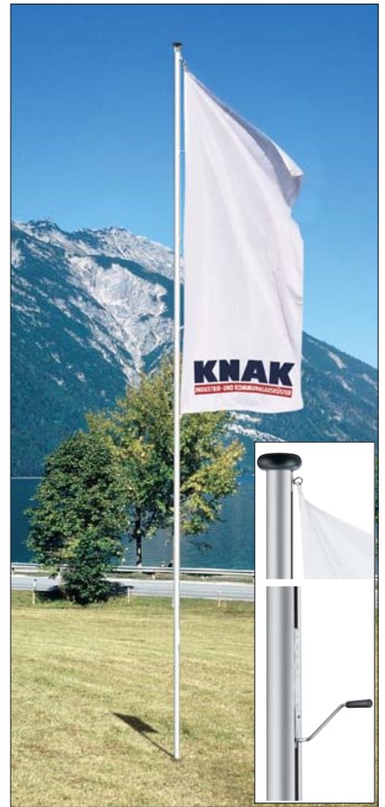
Flacher dekorativer Abdeckkopf und Sechskantkurbel