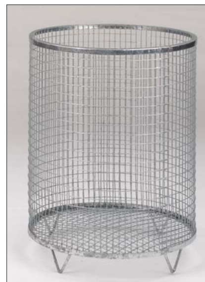
Drahtgitter Abfallkorb „Rund“ mit Gitterboden