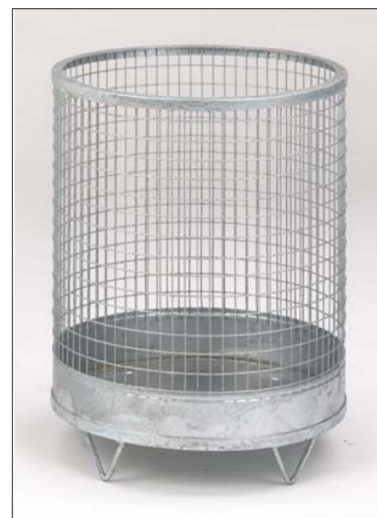
Drahtgitter Abfallkorb „Rund“ mit Stahlblechboden