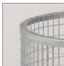
Oberring aus Winkelstahl