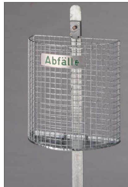
Abfallkorb „Halbkreis“ 27 Liter mit Eisenständer