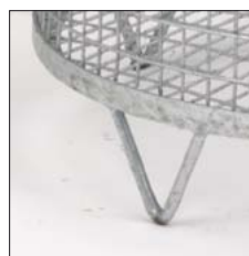
Standfuß aus Rundstahl