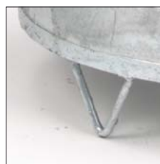
Blechsockel mit Standfuß