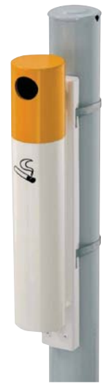
Ascher Typ „ZIGARETTE“