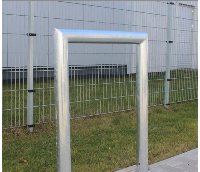
Fahrrad-Anlehnbügel mit Gehrungsschnitt ohne Mittelstrebe, Ausführung verzinkt, Durchmesser 60 mm