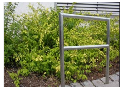
mit Gehrungsschnitt, mit Mittelstrebe, verzinkt, Ø 48 mm