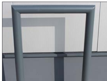
Fahrrad-Anlehnbügel mit Gehrungsschnitt, verzinkt + RAL 9007