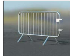
Absperrgitter mit 14 Füllstäben