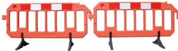
Absperrschranke in Reihe verkettbar und Füße verstellbar

*Hinweis: Anbruch einer Verpackungseinheit liefern wir auf Anfrage.