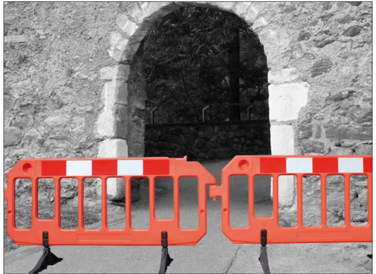
Absperrschranke aus Kunststoff