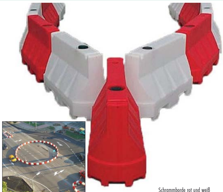
Schrammborde rot und weiß