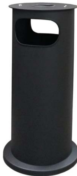
Abfallbehälter „PINIO“ mit Stahlblechboden