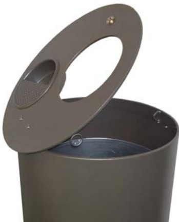
Abfallbehälter „WASTEX“ Bestell-Nr. 322 021 AD Euro -

Deckel klappbar und abschließbar mit integriertem Aschereinsatz.