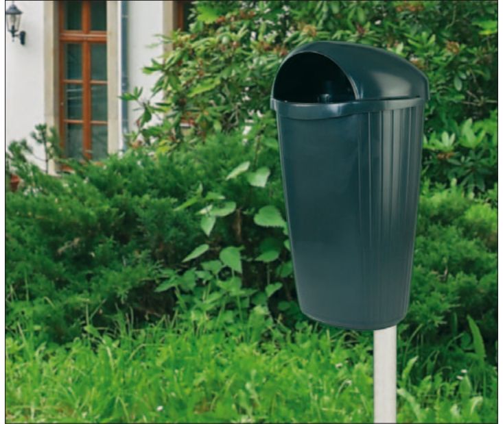
Abfallbehälter „Dinova“, Ausführung in der Farbe grau mit Rohrpfosten